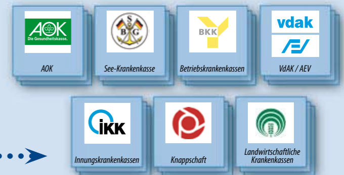
Daten-Annahmestellen der Krankenkassen